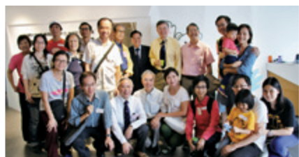
參觀中大賽馬會氣候變化博物館