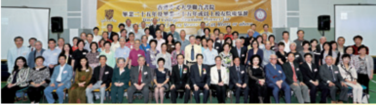
1978或以前畢業校友合照