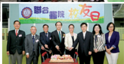
慶賀院慶切餅儀式