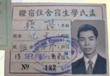
因孟氏基金支持而設有學生宿舍