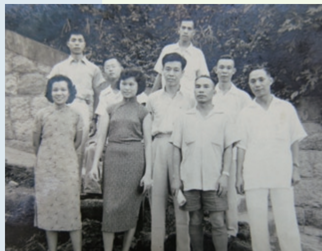
當時每年都有大旅行