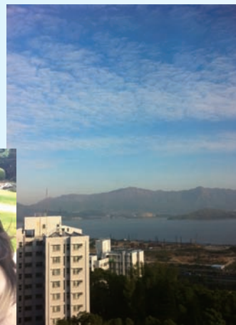
▲趙同學最愛遠望宿舍窗外的景色，是紓解學習上壓力的最佳辦法。