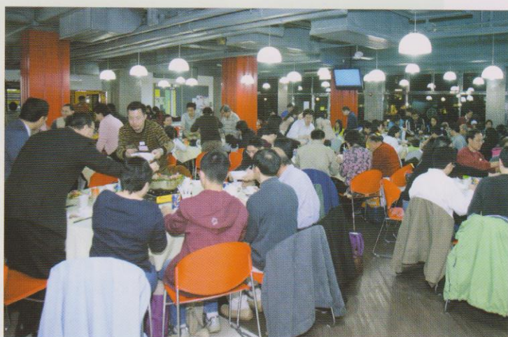
逾二百五十位聯合校友及家人參加聯合書院院長晚宴。