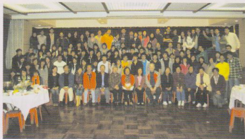
逾一百二十位「湯宿之友」於活動時大合照。