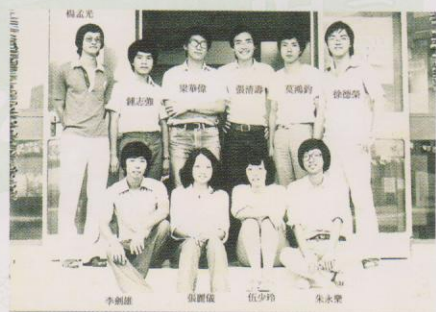
伯利衡宿舍第一屆宿生會幹事會