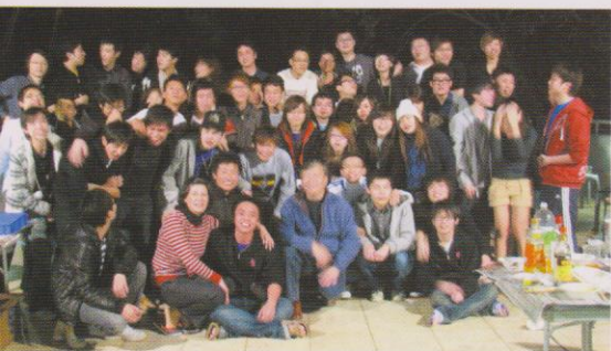
是次「恒生之友」活動大合照。