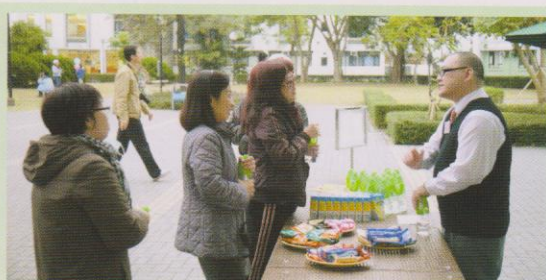
院長晚宴前，書院特設小型茶會，招待聯合校友及家人。