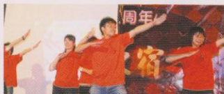
第五屆陳宿宿生會「聚星薈陳」當晚以節拍強勁的舞蹈為聚餐帶來高潮。