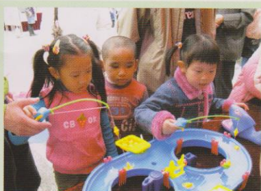
聯合書院校友會於中大校友日活動中特設會員招募及攤位遊戲，大受校友歡迎。