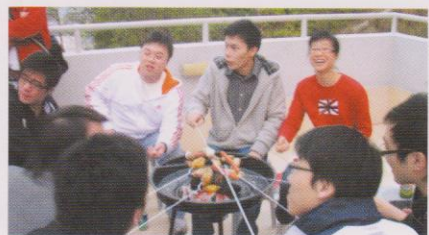
在恒生樓五樓半燒烤，格外親切。