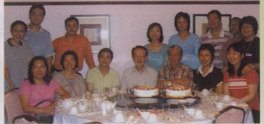
聯合社會學系一九八一年十三位畢業校友與兩位老師，切蛋糕、開香檳，慶祝畢業二十五年。