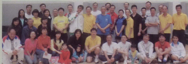
教職員校友聯隊勝出當日友誼賽。