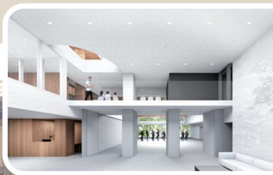
新宿舍入口大堂及多用途禮堂貫通，可見宿舍旁的樹群。