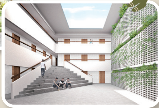
宿生共享庭園空間概念圖。