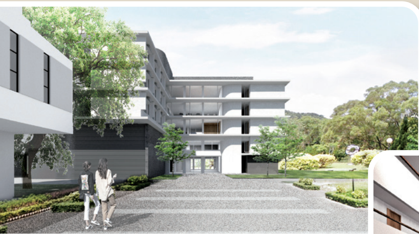
新宿舍正門入口概念圖。