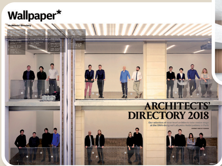
施校友的公司獲2018年 Wallpaper* 雜誌選為全球二十個優秀新晉建築設計單位之一。