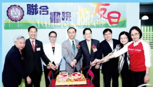
眾嘉賓主持校友日生日會切餅儀式。

2012 年聯合書院校友日於 2012 年 10 月 27 日(星期六)於聯合書院校園舉行。書院希望透過校友日，讓校友及家人一同回到母校慶祝聯合書院五十六周年院慶，互聚情誼，並了解母校最新發展情況，加強校友與母校的聯繫。