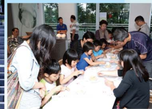
親子木糠布甸製作工作坊