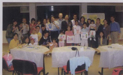
參與校友日當日安排之親子活動坊，小朋友發揮創意，創作DIY手帕。

當日約有一百位校友及家人一同參與。當日校友們參觀了文物館、胡忠多媒體圖書館及最新落成的陳震夏學生宿舍。再往書院的文怡閣享用下午茶，參加書院生日會。