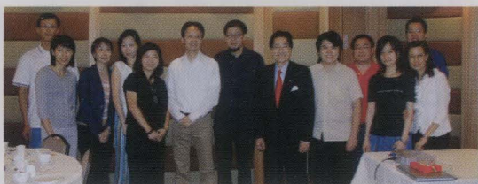
鄭先生與出席茶聚之校友大合照。