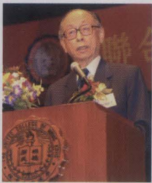
主禮嘉賓香港中文大學法律學院執行委員會主席楊鐵樑爵士致辭。

書院49周年院慶典禮及多項慶祝活動已於10月21日圓滿舉行。書院及學生會攜手共賀書院生日，舉行了一連串活動，包括於10月10日起舉行的「天使傾城」、10月13日舉行的咁「轎」去跑、10月17日舉行的「大笪地」及於21日正日舉行的49周年院慶典禮。