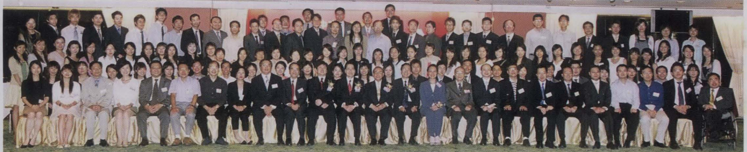
第六屆學長及學員大合照。