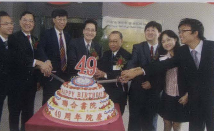
眾嘉賓主持切餅儀式。

慶祝活動的最重要節目，當然是21日晚於校園舉行的千人宴。當晚筵開130席，參加人數逾一千五百多人。晚會節目安排十分緊湊，除了樂隊表演、舞蹈表演、魔術表演及幸運抽獎外，還有兩位壓軸嘉賓，分別為劉浩龍先生及鄧麗欣女士獻唱流行曲多首，將晚會氣氛帶入高潮。當晚所有抽獎禮物均由熱心書院同寅、校董及校友贊助，書院校友會還慷慨送出全場燒豬，多位理事、幹事及校友更親臨參與盛會，與眾同樂。晚會直至十一時才在全場盡歡的氣氛中結束。