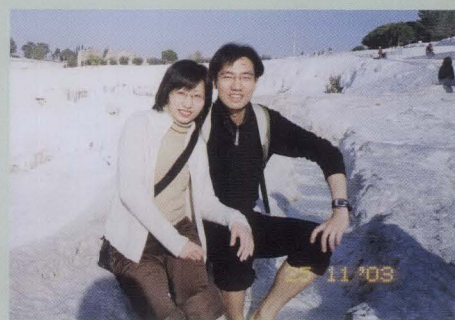
陳校友及高校友於土耳其旅行時攝。

聯合「湯宿一族」的誕生，牽引著我倆的相遇。結婚奏樂響起的一刻，亦造就了「湯宿一族」的重聚。也許，這就是「水塔」灌溉和「湯草」滋養下的緣份。