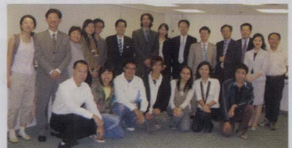
校友會創新首次舉辦之「聯合共敘」反應不俗，合共三十名聯合校友及學長計劃學員參加。