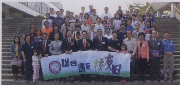
合共一百位聯合校友及家屬參與校友日，聚首一堂。