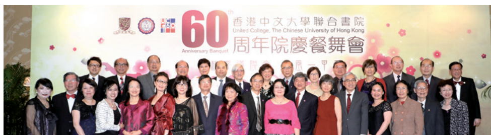
海外校友於六十周年餐舞會上合照。