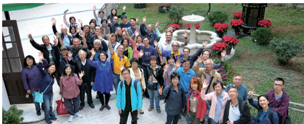
海外及本地校友參觀般咸道舊校址——般咸道官立小學。