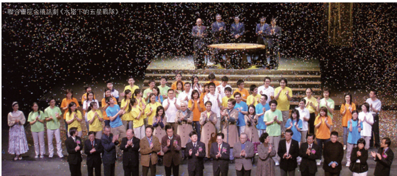
聯合書院金禧話劇《水塔下的五星戰隊》。

戲劇，是聯合的光輝傳統，雖然劇社的發展有起有落，但我們相信，總有對戲劇「發燒」的人！