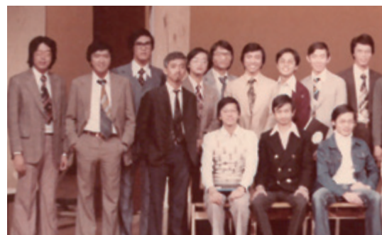
《十二怒漢》台前幕後與書院嘉賓合照。