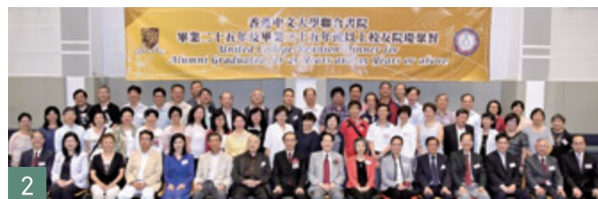
1979或以前畢業校友合照。