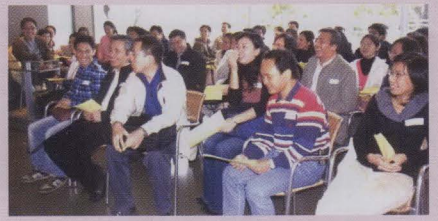
學長、學員在輕鬆的氣氛下分享經驗和心得。

聯合書院岑才生學長計劃於2006年1月14日在思源館舉行中期經驗分享會，藉以加強學長學員間的溝通及檢討計劃進度。當日共有六十多位學長學員出席，活動包括小組分享、卡拉OK及燒烤自助餐，氣氛既熱鬧又溫馨。