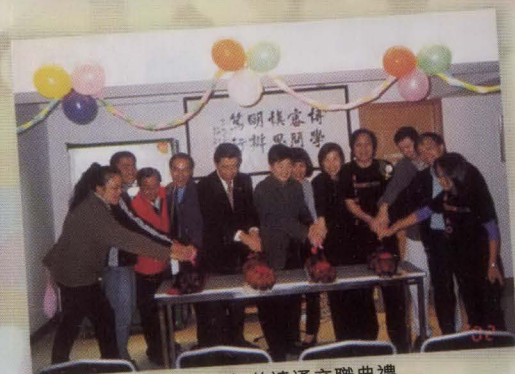
2002年伯達通交職典禮