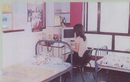
經過大裝修後的伯宿——房間、休息室及外貌