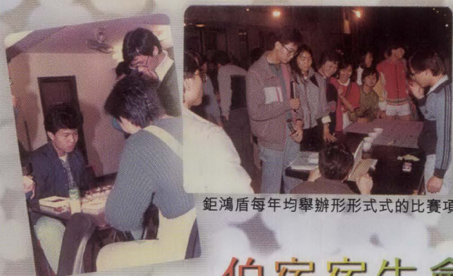
鉅鴻盾每年均舉辦形形色式的比賽項目