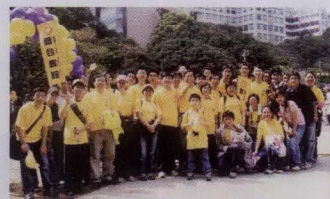
慈善健步行暨繽紛嘉年華