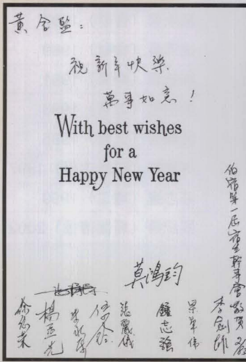
舍監黃鉅鴻先生收藏多年第 1 屆宿生會 83 年寄予他的新年賀卡