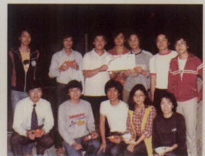
闖三關後在天台吃糖水宵夜，之後黃舍監便與伯宿宿生結下不解之緣。