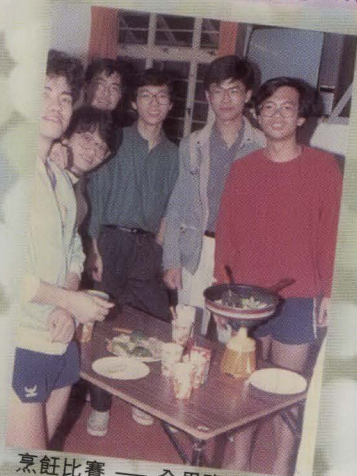
烹飪比賽 — 全男班參賽者