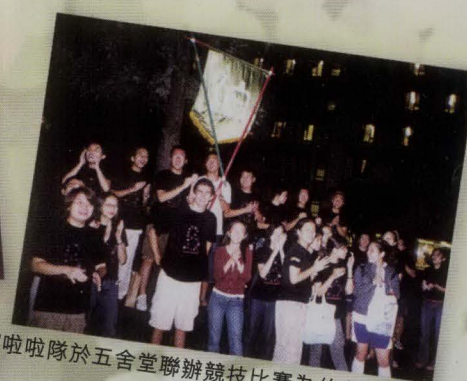
伯宿啦啦隊於五舍堂聯辦競技比賽為伯宿健兒打氣