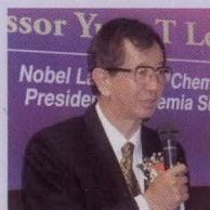
諾貝爾化學獎得獎人 李遠哲教授