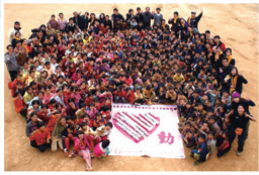
2006年12月，《心動》活動探訪廣西山區小學。