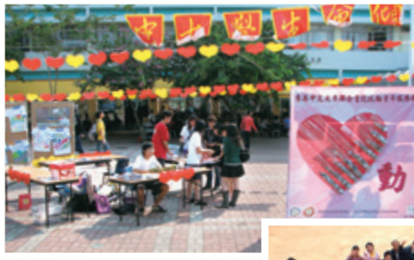
2006年10月，《心動》活動於中大校園宣傳及籌款。