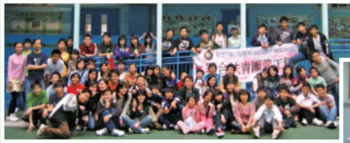
2006年，扶青探訪啟聾學校聽障學生，當中大部分團員均完成職業服務部舉辦的手語入門課程。