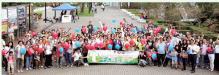
「千人同心健步行」籌款開步禮。