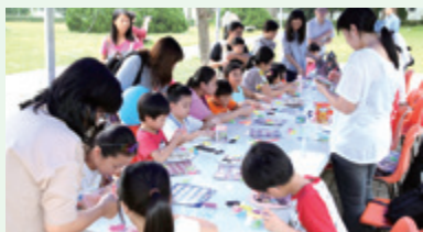
小朋友創意工作坊。