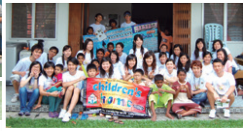
2007年5月，國際服務馬來西亞義工交流團探訪當地孤兒院。