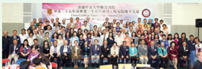
1979及1980年畢業校友合照。