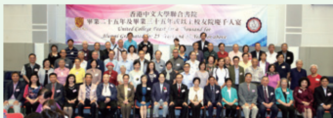
1958至1975年畢業校友合照。