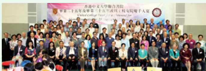
1976至1978年畢業校友合照。