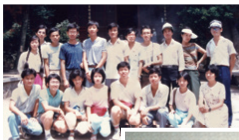
1985年盛夏，攝於杭州大學交流，參觀岳王廟。從各人的衣著打扮，不難分辨出誰是內地生，誰來自香港。