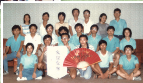
攝於1985年與杭州大學學生一場排球友誼賽之後，面上、身上都看得出我們的熱。