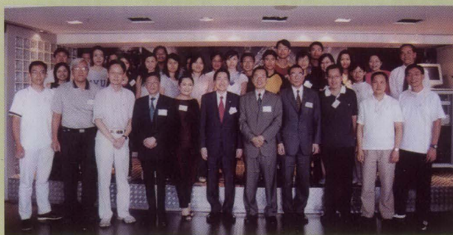
聯合書院校友會理事、幹事及顧問與 2003 年度畢業同學合照。