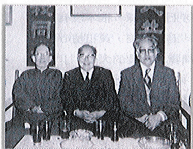
左起：牟宗三、徐復觀、唐君毅。新年合照。