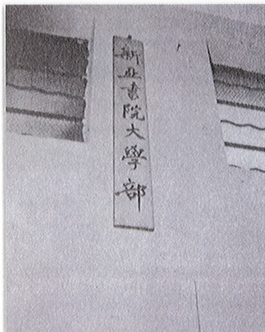
新亞書院掛在樓梯口之「大學部」招牌，當年違反港府規定。