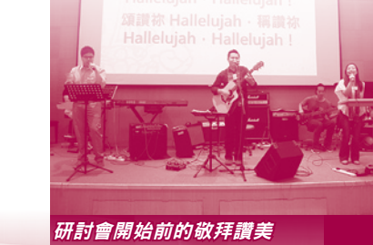
研討會開始前的敬拜讚美