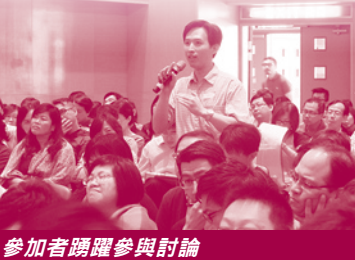
參加者踴躍參與討論