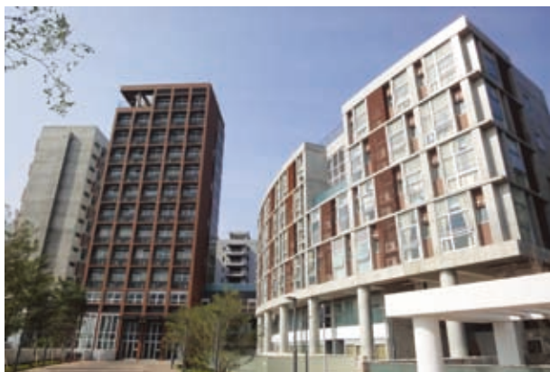
學生宿舍 (高座) 和格林伯格樓