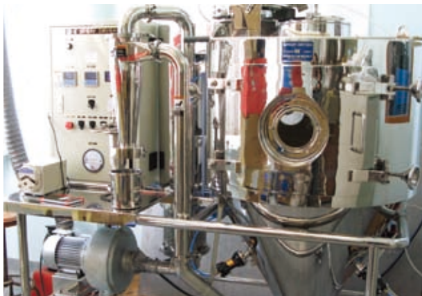
植物化學與西部植物資源可持續利用國家重點實驗室內設置的噴霧乾燥機

實驗室由中大、香港大學和中國科學院上海有機化學研究所金屬有機化學國家重點實驗室共同建立，主要研究新穎合成物的設計、合成與應用。