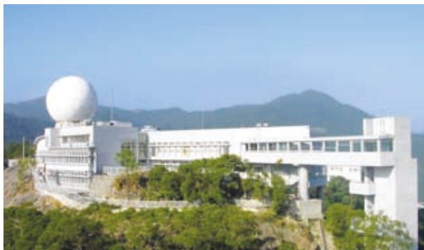
太空與地球信息科學研究所