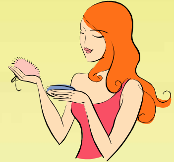
一名女乘客，本身是娼妓， 童年時曾被性侵犯