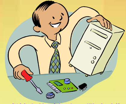
郵輪上的電報生，嚴重受傷， 但可以修理救生艇上的無線電