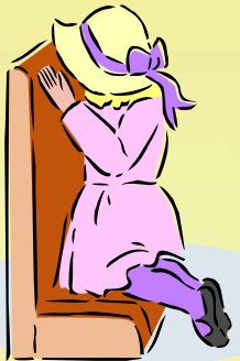
六歲大女孩但患有傳染病