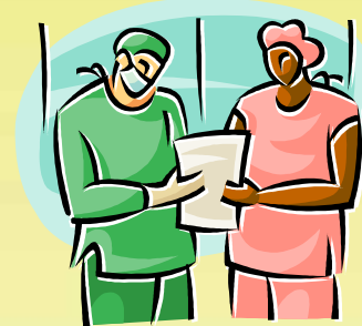
黑人男護士，但脾氣十分差