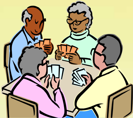
鼓勵院友發展個人興趣及與社區及家人保持接觸