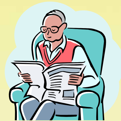
便利院友日常生活的資料