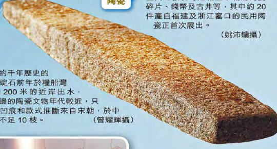
▲約千年歷史的花崗岩磁石前年於糧船灣對開約200米的近岸出水，由於周邊的陶瓷文物年代較近，只能靠其凹痕和款式推斷來自宋朝，於中國境內不足10枝。