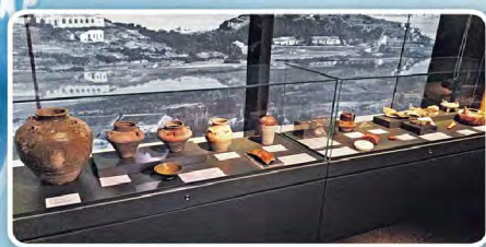
▲港鐵於沙中錢宋皇臺站的聖山北發現可追溯到宋朝的陶瓷碎片、錢幣及古井等，其中約20件產自福建及浙江寧波口的民用陶瓷首次展出。