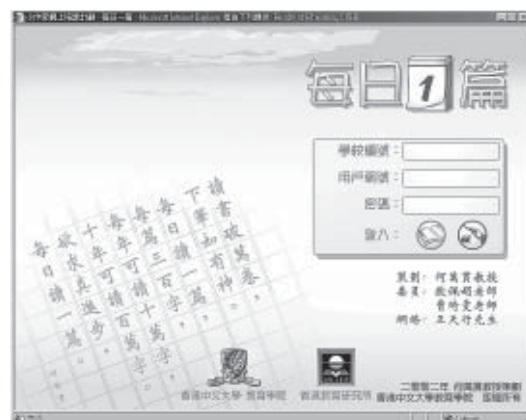
「每日一篇」網站首頁