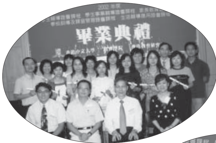
2002 年度各項證書課程畢業同學與導師合照