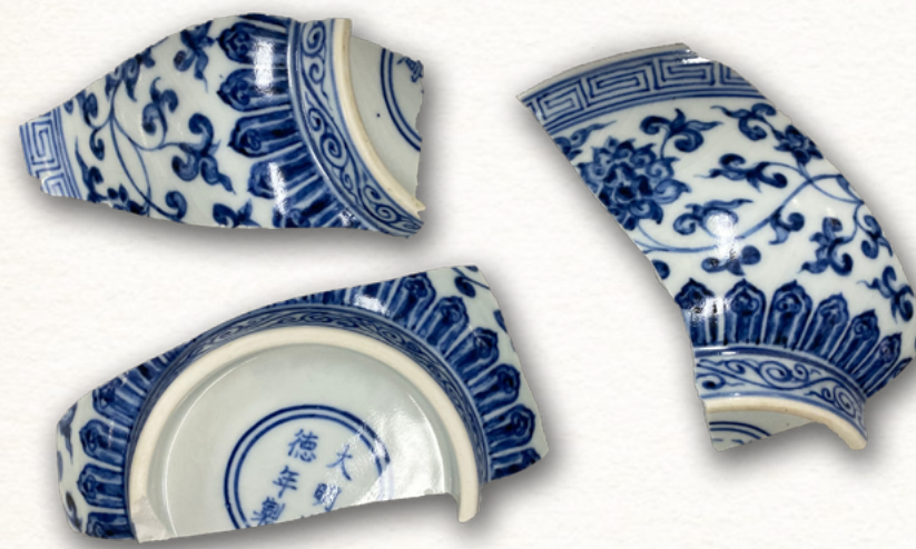
四川成都明蜀王府遺址出土青花瓷器

題，進行深入研究，以期提供一個新的視角去審視藩王在明代社會和文化方面的地位和貢獻。目前，研究團隊已進行多次實地考察，收集最新考古資料，建立並完善文獻及實物資料數據庫，籌備學術研討會，陸續發表第一階段研究成果。