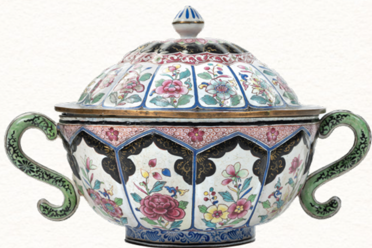
廣東銅胎畫琺瑯花卉紋蓋碗 18世紀 大學購藏 藏品編號 2020.0025

在前期研究的基礎上，憑藉香港本地收藏策劃展覽。組織學者分別從廣琺瑯發展脈絡、廣琺瑯與廣彩生產的關係、廣琺瑯的斷代、廣東透明琺瑯、廣琺瑯的不同使用者及市場、西方裝飾紋樣對廣琺瑯的影響以及清代廣東工藝（廣彩、廣琺瑯、外銷畫）間裝飾題材的互鑒等角度，對清代金屬胎廣琺瑯作更深入、全面的探討。擬於2022年秋舉辦專題展覽、出版學術圖錄及組織研討會、講座。