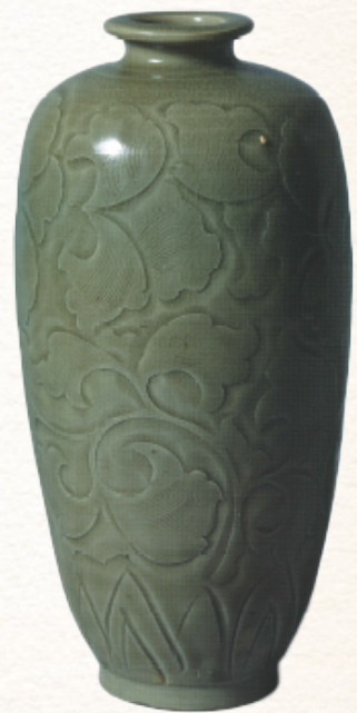
耀州窯青釉刻花瓶 北宋時期 上善堂 藏品