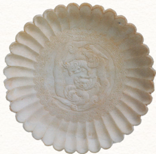
菊瓣形龍文白石盤 陝西省藍田縣北宋呂氏家族墓出土 陝西省歷史博物館藏

The jade artefacts of the Southern Song dynasty far surpassed that of the Northern Song dynasty in terms of quantity and decorative themes. They can be divided into three major categories: archaism jades, daily-use ornaments with floral and bird decoration, and jade wares imitating contemporary gold and silverware designs. Some jade wares in the latter group had even become models in archaism practices during the Ming and Qing dynasties. Liao and Jin, two nomadic powers, coexisted almost simultaneously with the Song dynasty in the north. Although the jades of Liao and Jin dynasties had their own characteristics, such as the jade horse belts and jade armbands of Liao, and the Chun Shui and Qiu Shan jades of Jin, the jades of the Song dynasty had a significant impact on them.