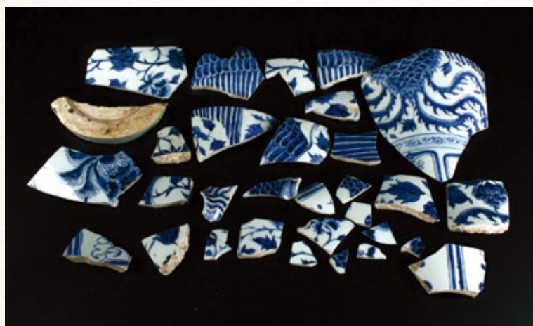
青花穿花鳳紋梅瓶破片 元·印尼爪哇出土 關氏家族惠贈

二〇一九年中國考古藝術研究計劃成立，為文物館藏品研究提供新的契機。這批瓷片標本，可作為以考古學方法入手，對博物館藏品進行系統整理研究的首次嘗試。經過本年度的嘗試，計劃會及時檢討項目方案，作出積極調整，將其發展成為可持續推廣的項目範本，將研究範圍擴展至其他公營博物館相關收藏、考古機構發掘標本等的整理研究中，惠及更多相關機構、團體及有志於中國考古藝術研究的個人。