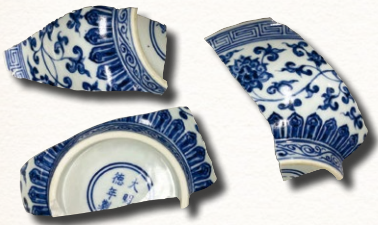
四川成都明蜀王府遺址出土青花瓷器

項目計劃從生產端和使用端對藩王用瓷展開調查，整體檢視與藩王有關瓷器出土的情況，與景德鎮瓷窯遺址考古發現及海內外館藏瓷器進行綜合比較研究。研究主要目的，是通過調查湖北、江西、四川、陝西等地藩王及相關人員的墓葬，特別是王府遺址出土瓷器的情況，建立藩王用瓷研究的數據庫；同時，透過文獻的蒐集和整理，對藩王用瓷的歷史背景信息進行全面的梳理。在此基礎上，針對不同歷史階段的重要面向，如明代空白期御窯生產中關於藩王瓷器的部分、晚明藩王在促進御窯和民窯瓷器風格相互影響的作用等問題，進行深入研究，以期提供一個新的視角去審視藩王在明代社會和文化方面的地位和貢獻。目前，研究團隊已進行多次實地考察，收集最新考古資料，建立並完善文獻及實物資料數據庫，籌備學術研討會，陸續發表第一階段研究成果。