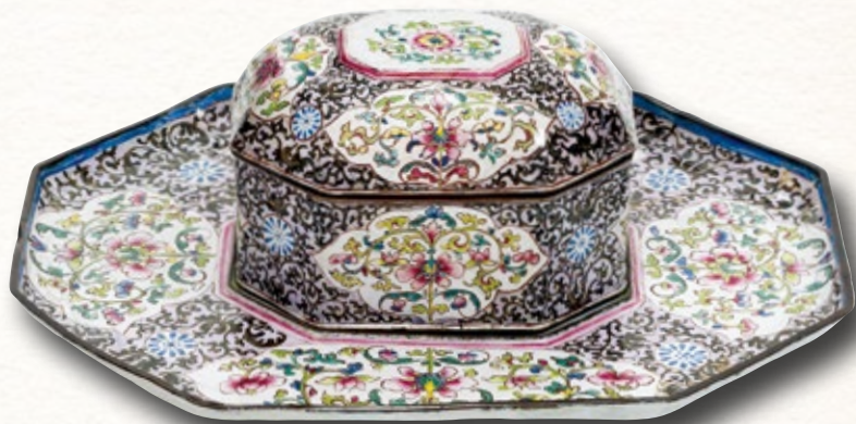
金屬胎畫琺瑯花卉紋檳榔盒及托盤 十八世紀·廣東 文物館之友惠贈