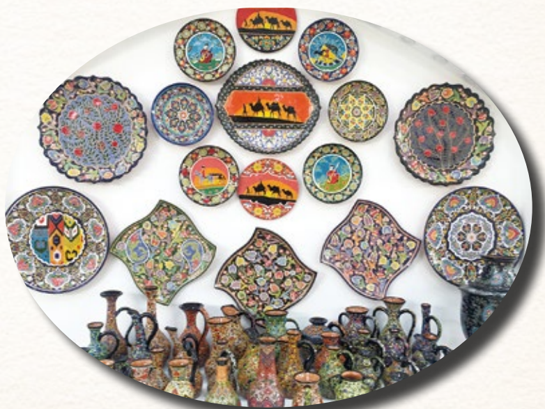
Products of the pottery factory