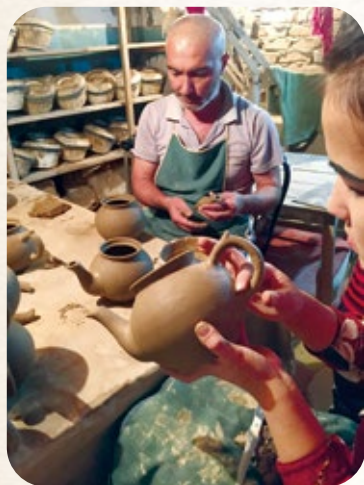
The pottery factory near Kokand