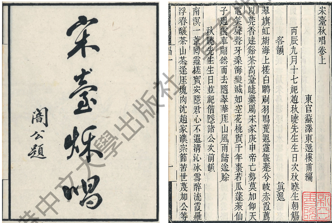
蘇澤東輯，陳伯陶等著：《宋臺秋唱》，1917年