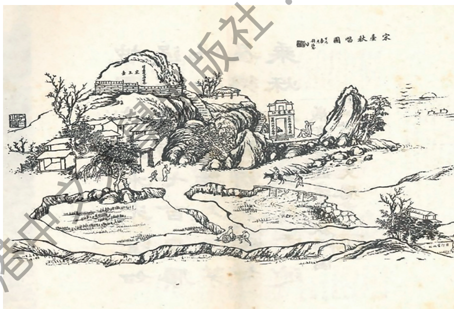
附：劉揚芬1917年〈宋王臺秋唱圖〉，載陳步墀著：《宋臺集》，1919年