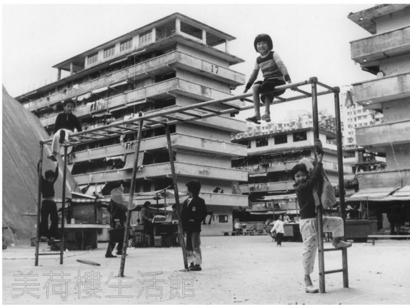
石硤尾邨1954年建成，是香港最早期、碩果僅存的「H」形6層從置大廈，屋邨期後重建，其中一座美荷樓保留，（「美荷樓生活館」Facebook圖片 / 高潔強先生拍攝）

石硤尾邨是香港第一代公共房屋，在該處居住過的長者經歷過多個時期的生活面貌，也有着比較強的鄰里網絡，亦因為其H字型的公屋設計，令那時的鄰里關係較在緊密。例如，在1960、70年代，石硤尾邨街坊會在中秋節舉行「蠟燭比賽」，隔著中間走廊，兩邊的街坊會向挑戰對面的街坊，各自排列出不同蠟燭陣型、圖案，看看哪一邊比較漂亮。又例如，以往公屋沒有廚房設備，家家戶戶要在走廊借用爐頭煮食，當時的小朋友要負責將餸菜從走廊擡到單位內，但小朋友沒有太大力氣，會將餸菜放入膠兜內，再放在地下，慢慢拖回家，稍一不慎，就會把餸菜打翻，當日的晚飯就泡湯了。