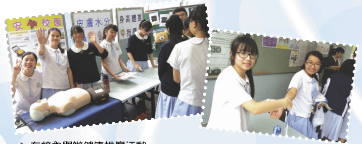
▶ 在校內舉辦健康推廣活動，促進校園健康。