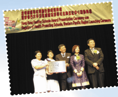
▶ 榮獲香港中文大學頒發「健康學校銀獎」

學校於2004/05及2015/16年度通過「香港健康促進學校認證系統」的認證程序，兩次獲得健康學校銀獎殊榮，並在多個發展領域獲卓越評級。展望將來，我們會堅持推動健康促進學校，讓師生皆擁有健康的人生；更努力肩負起推廣健康教育的使命，協助更多學校建立健康促進學校。