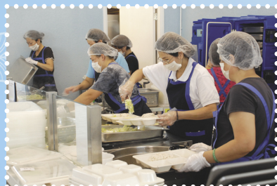
▶ 增建「健康環保飯堂」，實施現場派飯模式，培養健康飲食的習慣。