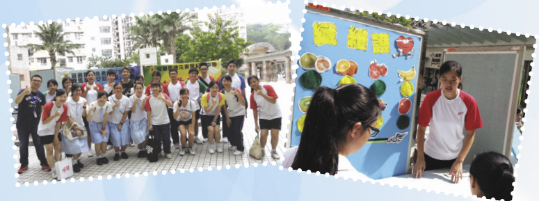
▶ 在粉嶺社區內舉行健康推廣活動，推動關注心臟健康。