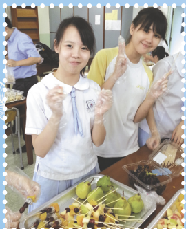
▶ 舉辦「水果日」鼓勵學生多吃水果，以預防各種慢性疾病。