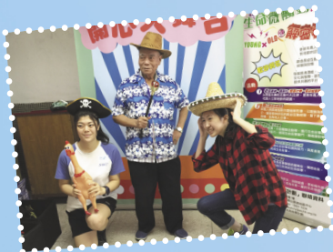
▶ 為區內長者擬寫「生命故事」，實踐長幼共融及協助長者達至完滿人生。