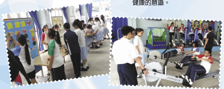
▶ 舉辦「健康推廣周」鼓勵學生關注個人健康