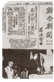
《聯合新聞》報導有關書院前身的五所私立院校合併為聯合書院的消息。

得知院校困難情況，建議把各院校的力量集合起來。經與各院校校長商議，最後廣僑、光夏、華僑、文化、平正五院同意合併，組成「香港聯合書院」，以致力提高學術水平及改善課程為共同目標，並以宏揚學術自由、促進中西文化交流及服務香港為己任。書院獲亞洲協會及孟氏基金會等學術機構提供部份資助，校本部設於堅道147號，於同年十月二十六日正式開課。