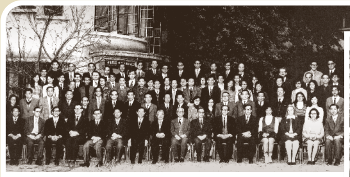
遷往沙田前書院同仁於般咸道校園合照。