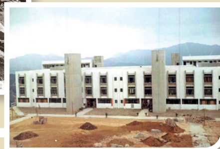
1971年12月，湯若望宿舍剛建成時攝。