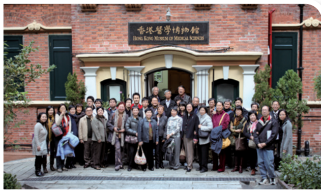
2009年11月21日，聯合書院舉辦舊校尋根之旅，與聯合校友同遊堅巷舊校舍——香港醫學博物館。