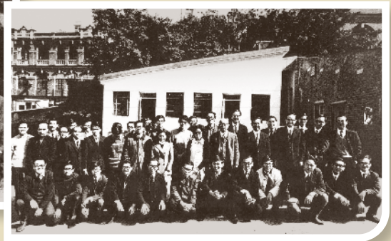
遷往沙田前理學院同仁於堅巷校舍合照。

及資料搜集工作。1975年，書院歷史系首設香港史。這些發展，一方面配合大學的社會研究中心進行對當代香港種種社會問題的研究，同時亦增加學生及社會人士對香港過去的認識，對香港人身份的認同，不但有助擴闊學科領域，對減輕社會矛盾也不無幫助。」