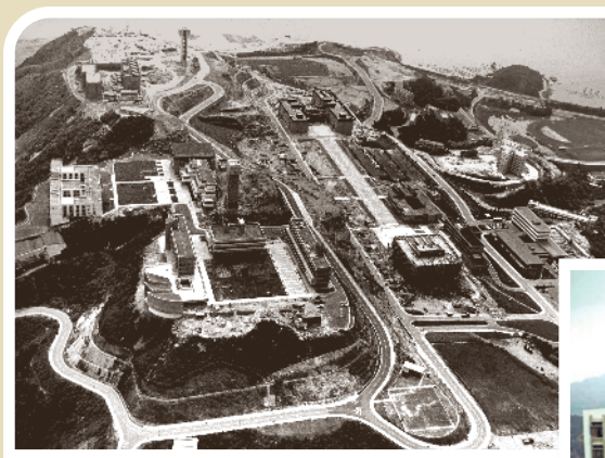
沙田校舍初期照片。