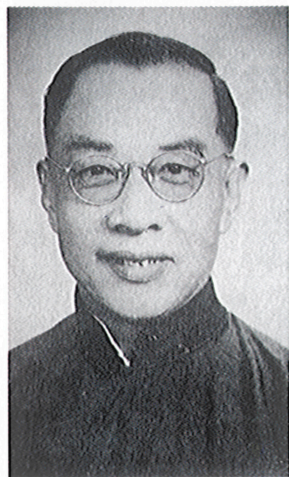
校長兼文史系主任錢穆