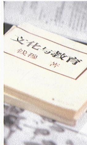
錢穆《文化與教育》值得今人參考