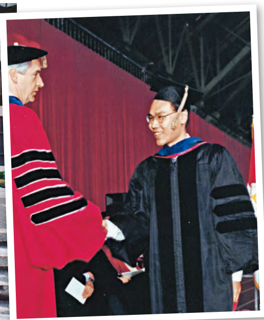
▲ 在康奈爾大學畢業並取得博士學位，開啟了蕭校友在美國的研究之路。

理，大多發生在宇宙大爆炸一兆分之一秒後，一兆分之一秒前發生什麼事，正是我跟其他科學家在努力研究的事情。」