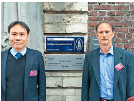
▲ 2014 年為提出宇宙大爆炸起源論（Big Bang Theory）的 Georges Lemaître 120 歲冥壽，蕭文禮專誠前往比利時，見證他的工作室立碑紀念儀式。

他對物理的熱愛，早在小學時已萌芽，「自小已是『問題少年』，喜愛『打爛沙盤問到篤』，周末爸爸帶我和妹妹外出，妹妹學鋼琴及芭蕾舞，爸爸可能怕了我不斷提問題，就帶我到圖書館，自己尋找問題的答案。於是歷史、小說、文學、科