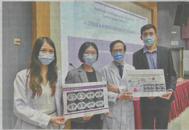
■中大團隊研發的人工智能系統，為臨牀醫生提供即時可靠的診斷結果。

香港中文大學研究團隊開發了一個人工智能 (AI) 系統，可快速及準確地自動檢測胸部電腦斷層掃描 (CT) 影像上的新冠肺炎感染病灶，為臨牀醫生提供即時可靠的診斷結果，而系統亦僅需四十毫秒，即百分之四秒內即可準確評估整個三維CT影像，較傳統的臨牀閱片流程需時五至十分鐘更具效率。該項研究近期已發表在「Nature」旗下綜合期刊《npj Digital Medicine》。