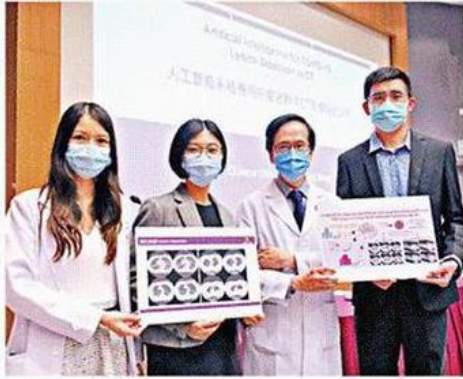
■中文大學研究團隊開發人工智能系統，可快速診斷新冠肺炎患者。

【本報訊】人工智能或可協助辨識新冠肺炎患者！香港中文大學研究團隊開發了一個人工智能系統（AI），可快速及準確地自動檢測電腦斷層掃描（CT）影像上的新冠肺炎感染位置，其準確度高達96%，料可用於診斷、監察治療病情進展及預測治療成效，以減少人手及人為失誤。研究已發表於《Nature》旗下綜合期刊《npj Digital Medicine》。