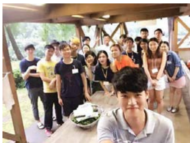
右圖是當天的合照（當中有中港日美韓不同的學生）