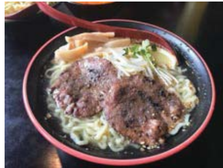
冷やし牛タンラーメン