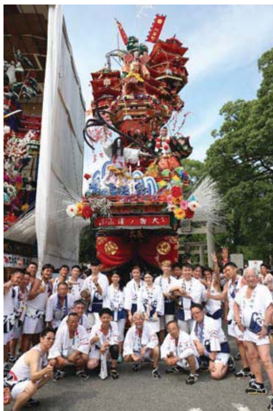
日田祇園祭——與鋒的合照