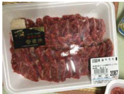
一番美味しい牛肉、豊後牛