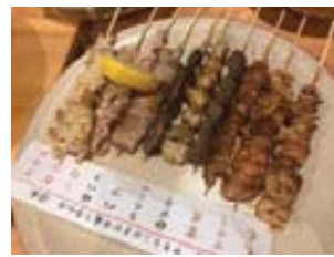
いろいろな串焼き