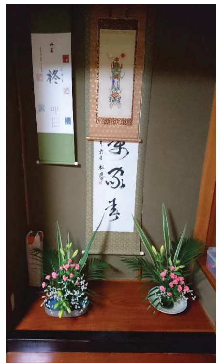
我和 Fun Fun 的作品