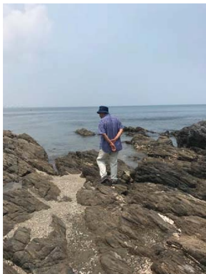
海を観ていました

お兄さんは一所懸命に働きます。店の他の仕事もあります。セキュリティの仕事です。商工会や消防のポストもあります。親切で、犬飼町には人気があります。