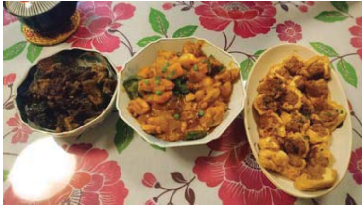
從左到右依次序為：苦瓜炒豆豉鮫魚、大盤雞、釀豆腐