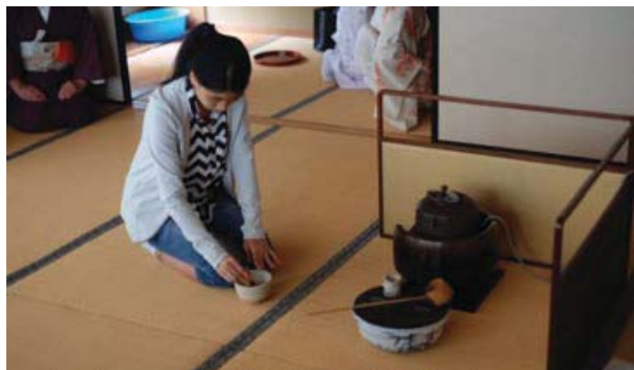
嘗試用茶筴攪混茶

面對外，再鞠躬以示尊敬。不過，對於我來說，最困難的可能是需要正坐，要一直維持這個姿勢令腳有一點麻痺。然後，我們參與了乘馬教室。一開始我還是有些害怕的，但是騎上馬之後，一邊搖着，一邊感受到微風吹過來，感覺挺不錯的。