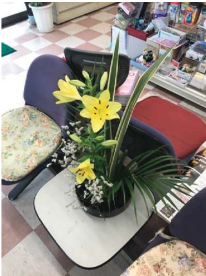
店の飾りになった華道の花

馬を見たことも乗ったことも始めました。多分危なかったですから、馬に乗った時間は短かったで、馬も遅く歩きました。ちょっと残念でした。でも、馬の上で観た景色は素敵でした。