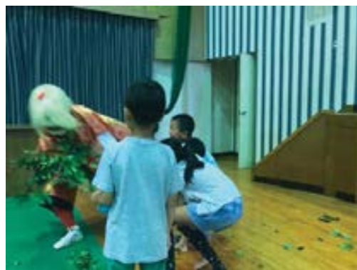
子供達が鬼と木の争い