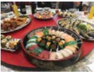
20周年大会の晩御飯