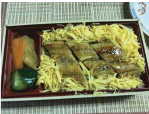
うなぎの日はうなぎを食べるのです！