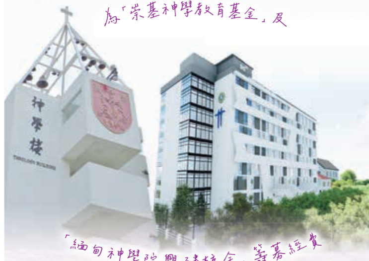
為「崇基神學教育基金」及