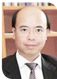
蘇鑰機教授 香港中文大學新聞與傳播學院 院長