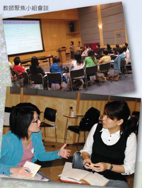
同工分享學校支援讀寫困難學生的情況