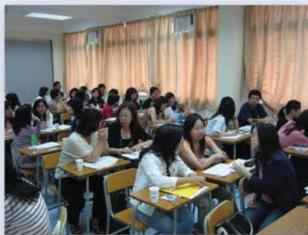
學員投入課堂活動

學員不單在評分項目給予高度評價，也在問卷的開放題目寫下不少正面的評語。大部份的學員認為課程架構清晰完整，內容豐富。他們更欣賞課程導師的專業知識，認為導師們不但講解有條理，而且能夠以具體的例子解釋抽象的概念與艱深的課題。