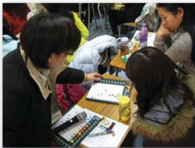
導師向學員展示小組輔導教學的教材