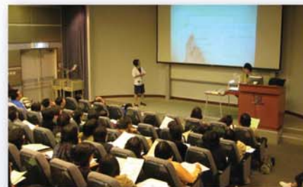
課程導師講解讀寫困難學生的學習特徵

自「優化語文教學 支援讀寫困難學生」課程推出以來，參加的教師均予正面評價。這可從課程評估的問卷結果反映出來。每位學員修畢課程時，會填寫一份包括21題評分項目及3題開放題的課程評價問卷。2006-2007學年，我們開辦了九班培訓課程，共506名教師參加，課程評價總平均分為5.26分。2007年9月至2008年5月，我們開辦了九班培訓課程，共658名教師接受了培訓，而課程整體評分為5.41分。問卷結果反映修讀學員對課程予以高度評價。以下是本年度課程評價問卷的整體結果。