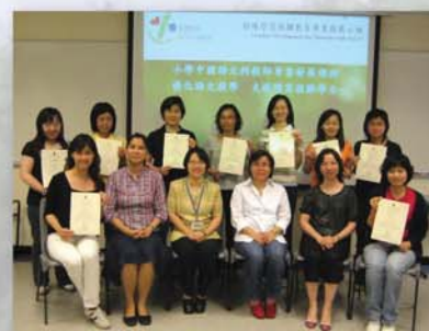
學員完成課程後，獲頒發修課證書

我校有11位中文科教師參加了這個課程。從教師的分享中，我看到他們對識字與閱讀教學的關係，口語練習與寫作教學結合等有更深刻的分析。科主任更向全體同事推薦本課程的網頁內容，包括高頻用字表和閱讀策略教學練習樣本，都是一些應用和參考價值高的資料。當我們堅持所有學生都掌握基本語文能力，當我們關注課堂內照顧學習差異，教師便需要對學生學習語言的認知發展，語文學習的層次，不同能力互補和促進的關係等有更深入的了解。這不只是加強輔導班教師的責任和需要。