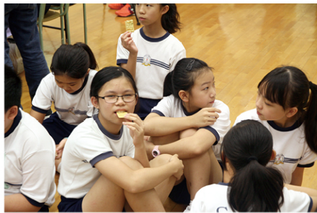
●「貧窮」一方的學生，則要坐在地上捱餅乾。

「微城市·貧富宴」在小學六年級服務學習課程屬預備階段，目的在使學生對將要學習的課題——「香港的貧窮問題」有所準備。這種準備既有智性，也有感性方面。有關社會問題的學習並非單純的理性認知，更重要是希望學生能從感性方面產生觸動。這種觸動，不但是學習動力的來源，更是日後學以致用的延伸力量。學生經歷「微城市·貧富宴」後，更會進行社區實地探訪活動，並且藉着裝置藝術把親身的經歷和感受去感染全校同學，搖身一變成為倡議者去鼓勵同學投入每年的「聖誕暖 LOVE LOVE 捐贈食品大行動」，幫助有需要人士。