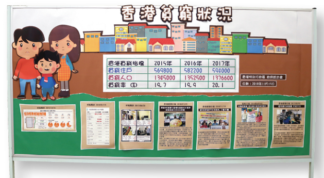
● 學校將有關香港貧窮狀況的資料，整理並呈現在展示板上。

「斬小」由一年級開始，於每年的常識科課程中加入「服務學習」元素，讓學生透過服務學習，認識社區與他們的關係，培養學生關心社會、服務他人的態度及行動。小學六年級常識科與服務學習有關的主題原為「全球的貧窮問題」，然而，讓學生認識社會的問題，不應只視為知識的學習；更重要是培養學生對眼前社會現象的思考、對社會問題的關注，甚至有所行動和付出。因此，與其從「全球」角度來認識貧窮問題，倒不如更貼身去了解學生所身處社會的貧窮現象。因此，為使學習更「貼地」，主題便定為「香港的貧窮問題」。