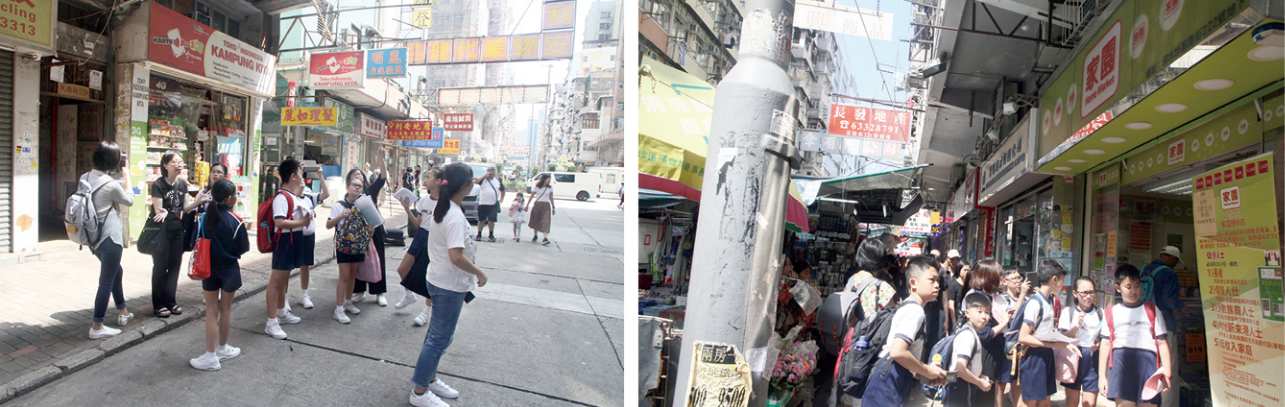
● 學生到深水埗區進行實地考察，了解社會的貧窮問題。