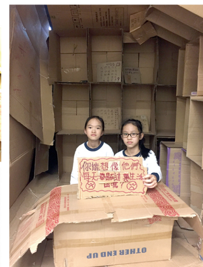
● 同學製作的割房，以舊紙皮搭建，並開放予家長及其他同學進入參觀，從中體驗社會的貧窮情況。