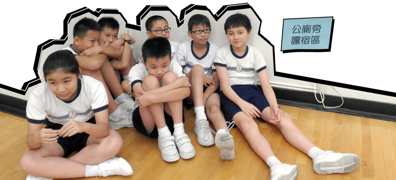
● 資產過少的學生要被遷至露宿區。