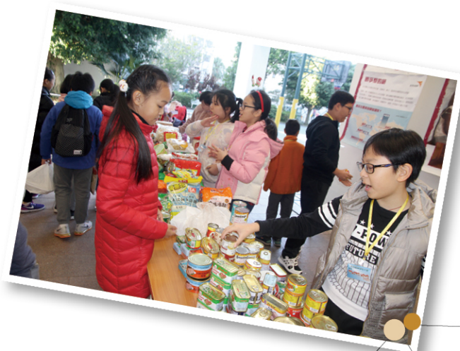
● 學校舉辦「聖誕暖 LOVE LOVE」食物捐贈行動，以喚起同學對他人的關愛之心。

考察在汝州街、大南街、基隆街進行，學生可從不同角度，觀察該區居民的生活狀況，例如比較該區與自己居住社區的物價、商店所販售的物品等等。學生發現在香港繁華璀璨的另一端，原來仍有人要走幾十級樓梯才能步進家門，仍有人寧願花費五元修理雨傘也捨不得丟掉。行程雖短，卻豐富了他們對世情的感知，回校後，他們接受了 QSHK 三堂藝術指導課，便將閱歷幻化成割房屋的一個裝置藝術，推廣「聖誕暖 LOVE LOVE」食物捐贈行動，並於家長日展示。