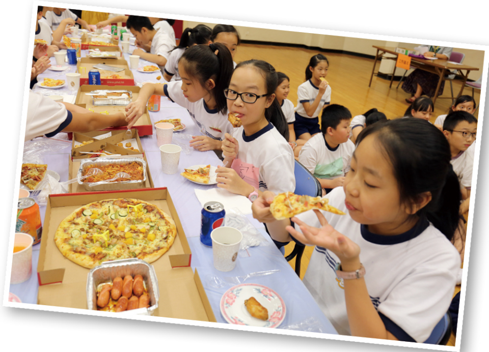
●「富裕」一方的學生，可坐到桌子上享用薄餅等美食。