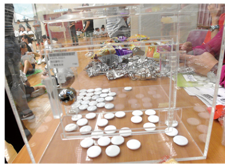
● 貧富宴勾起了學生的同理心，「富裕」一方的同學把手上的金錢捐贈給露宿區的同學。