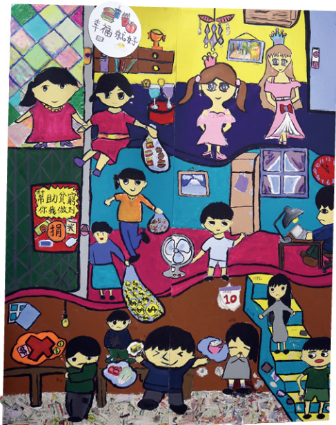
● 2018 年度，學校將「劏房屋」換成巨型創作畫，把關注香港貧窮問題的訊息傳給全校學生及家長。

「我們希望這次裝置藝術可以有更多的互動性，也希望在設置作品及選取材料上讓同學有更自由的發揮空間，真想不到出來的效果十分良好，家長參觀過後都說有『心酸酸』的感覺。」陳嘉藝老師說。