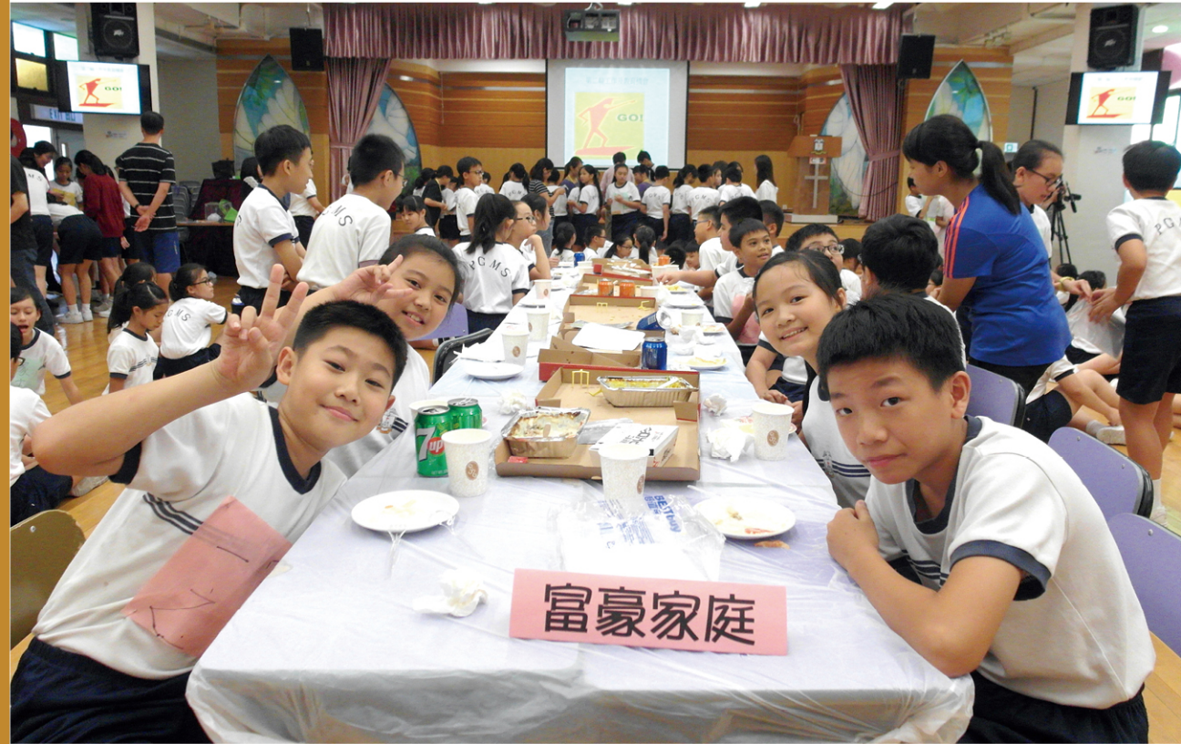
● 學校舉辦「微城市·貧富宴」，讓學生更貼身了解香港的貧窮問題。

五旬節斬茂生小學（下稱「斬小」）老師抓住這點，設計及優化現有的小六常識科服務學習課程，跳出過去在課堂以資料搜集、影片分享、個案分析等傳統方法，轉為與視藝科合作，進行結合藝術與服務的跨學科學習。期間推行一系列的實驗活動，包括以虛擬的「微城市·貧富宴」社會經歷活動、深水埗實地考察及製作裝置藝術，讓學生更真實及立體地體驗本地貧富懸殊帶來的影響，了解香港貧窮問題的複雜成因及可行的解決方法。其後又透過學校每年舉辦的「聖誕暖 LOVE LOVE 捐贈食品大行動」，將認知及感受化為服務行動，呼籲學生捐獻食物予「食物銀行」，以幫助貧窮人士紓緩日常生活面對的困境。