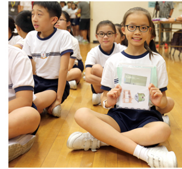
●「貧窮」學生正展示她寥寥無幾的家當。

不過，學校最初對於 QSHK 提出要舉辦「貧富宴」有所保留。因坊間類似的活動，一般較形式化，效果並不理想：學生只不過稍經歷「捱餓」的感覺，卻未能從中聯繫課題中所探究的貧