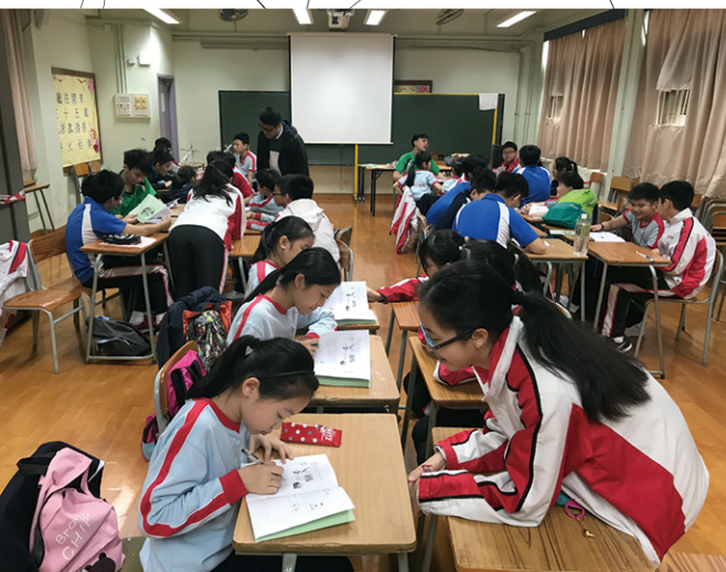
● 服務領袖生與學生義工正為小學生補習英文。