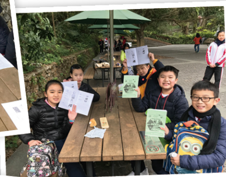
● 小學生在服務領袖生的安排下，認識了不少動物亦學識了不少相關英文生字。