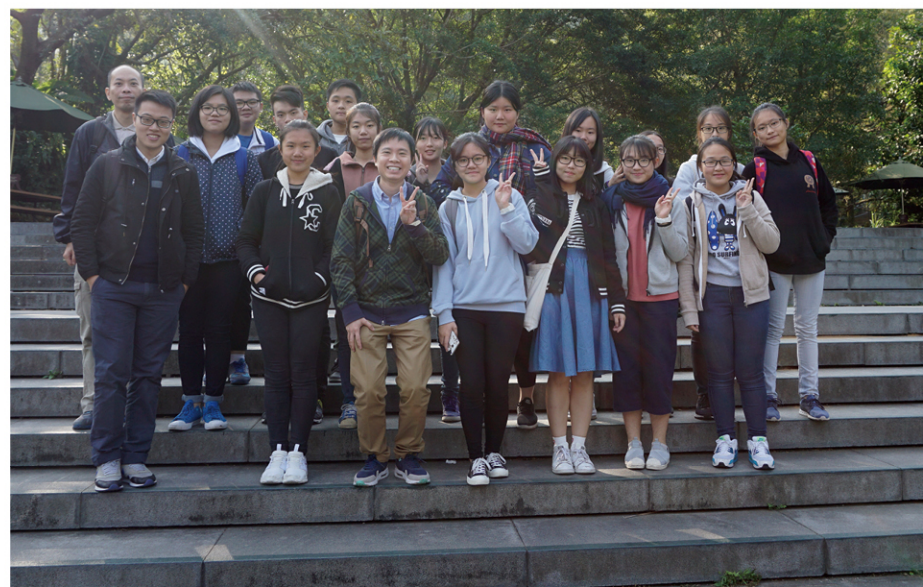
● 在帶領小學生前往嘉道理農場參觀前，服務領袖生與老師一起先到農場考察。

起初，服務領袖生對於服務對象的需要也茫無頭緒，經過一輪調查與交流後，他們決定給小學生補習英文，提升他們的語文水平；又帶他們到區內遊覽，熟悉社區；同時舉辦遊戲日，讓小學生融入社群。到了第二年，由於已有經驗，加上與小學生混熟，深知他們學校重視STEM發展，故服務領袖生再以環保為主題，貫穿整年的活動，例如帶小學生前往嘉道理農場參觀，並滲入英語教學來讓他們認識動物；另外，又在遊戲日加入STEM元素，與小學生一起用環保物料製作水火箭、羅馬炮架等，讓他們可以寓學習於遊戲。