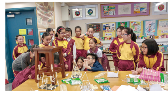
● 學生利用木條及木衣夾製作教堂模型。

察時知道要點，二來有導賞，他們又可隨意參觀並素描景觀，多重感官學習，特別有趣吧。」