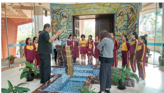
● 學生參觀教堂後，把建築物素描出來（左圖）。