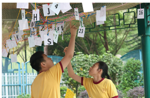
●「愛與『童』行」以玩為主題，讓學生從玩樂中，探討兒童權利並服務他人。