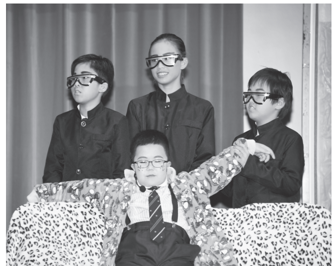
▲ 馬鞍山循道衛理小學 冠軍作品《自理達人》