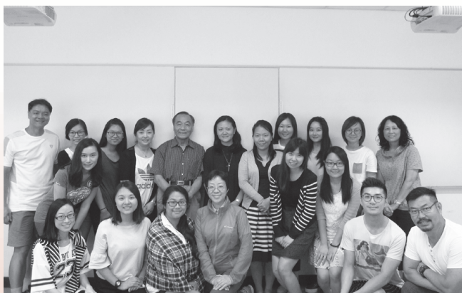
▲ 劉珣教授(後排左五)與MTCI學員合影

2016年7月，中心訪問教授、北京語言大學劉珣教授以“漢語教材分析”為題，給碩士研究生做系列學術報告。部分課堂實錄上傳中心Facebook專頁。