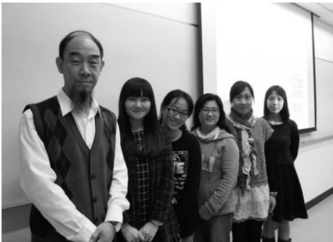
▲張凱教授(左一)與學員合影

3月上旬，本中心“普通話教育文學碩士學位課程”請到北京語言大學張凱教授為“語言測試的理論與應用”單元授課。張凱教授深入研討語言測試理論和實踐，講課精彩生動，博得學員好評。