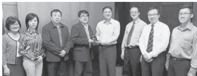
▲與馬來西亞華文理事會同仁合影