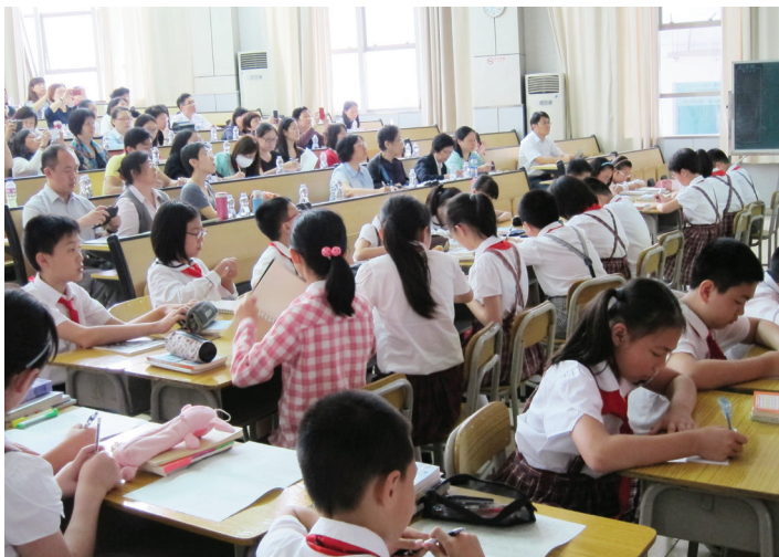
★天健小學學生上課

該課節有近四十名二年級生上課，課題為《畫家與牧童》，教學時間為四十分鐘。課節可分為導入、過程、總結三大部份，與香港大部份推行普教中的學校的教學模式相近，筆者認為當中的教學細節兩地各有長短，現加以說明。