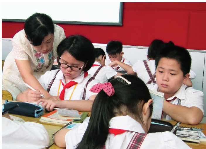
★老師指導學生做預習

筆者認為除了深入教授字的結構外，字音亦不容忽視。由於香港學生不及內地學生般自少學習拼音，筆者建議可針對部份的字詞進行延伸教學，例如教學生“原”字時，可請學生指出與“原(yuán)”拼音相同的字例，例如“圓(yuán)”、“園(yuán)”，喚起學生的已有的字詞知識及聯繫，引發他們的聯想力及學習興趣。