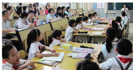
★天健小學觀摩交流