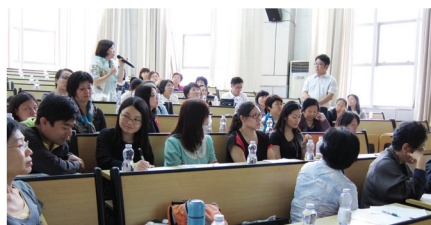
★學員在座談會上發言