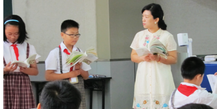
★小五古典名著教學