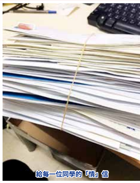
給每一位同學的「情」信