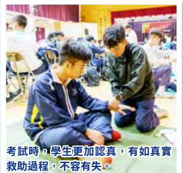
考試時，學生更加認真，有如真實救助過程，不容有失。