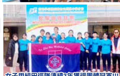
女子甲組田徑隊連續3年獲得團體冠軍!!!