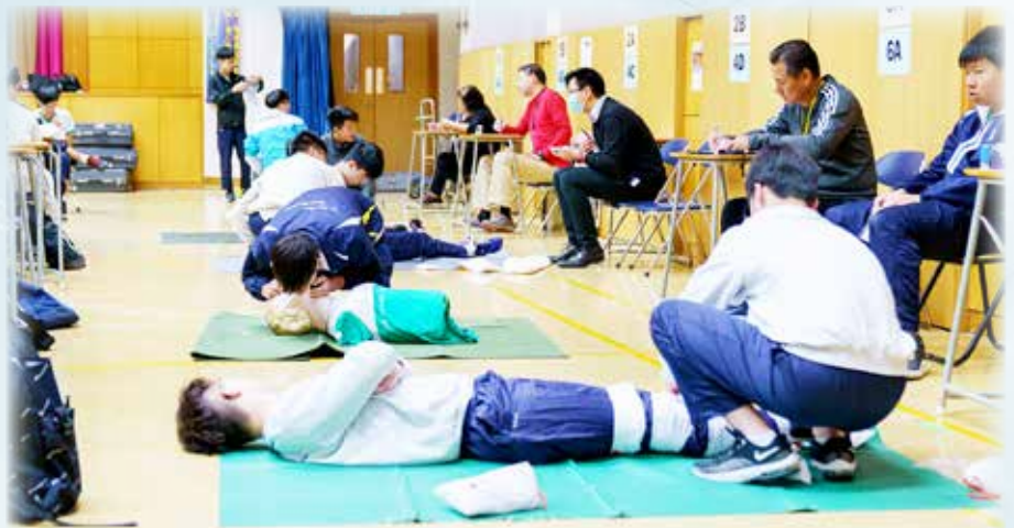
真正的知識是透過考驗展示出來，從舉手表示完成考試，可見同學自信心增加不少。

多謝學校給中四同學機會參與紅十字急救課程，雖然只有短短兩天的實習課，但我獲益良多。我們學了心肺復蘇法、外出血急救處理以及骨折急救處理。兩種急救處理都有很多種包紮方法，所以在上課時都要加倍留心，聽導師講解。我覺得這個課程對我日後會有很大幫助，因為日後有人遇意外，可以進行急救，或者日後工作亦可能有幫助。雖然急救不是每個人的興趣，而且考試時的氣氛的確非常嚴肅，但也是個相當深刻的經驗。