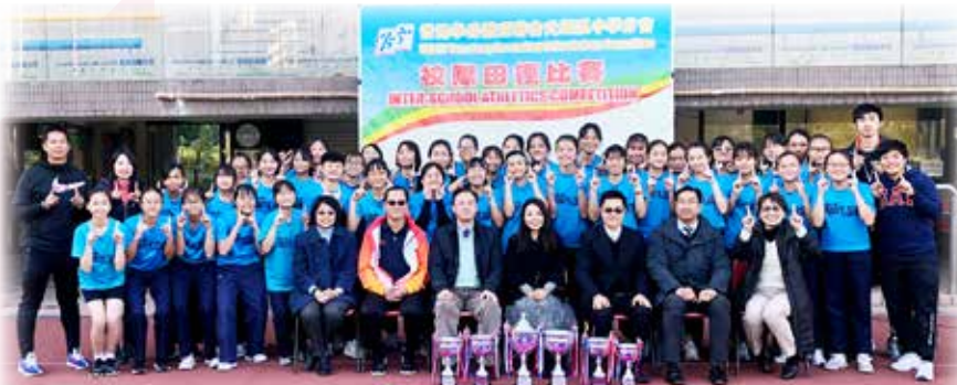
女子田徑隊獲得學界「女子團體總冠軍11年霸」

本校田徑隊於元朗區學界田徑賽再次獲取佳績，男子組獲得「男子團體總殿軍」，且女子隊更連續第十一年獲得「女子團體總冠軍」，為天循田徑隊延續傳奇。