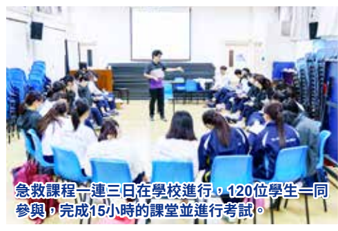
急救課程一連三日在學校進行，120位學生一同參與，完成15小時的課堂並進行考試。

目標：本著全人發展教育的方針，學校不只重於學術層面的教育，更想建立學生多方面的能力。因此於2019-2020年度起，為中四全級學生提供急救課程。校方全數資助課程費用以學習機會均等為前提，為學生提供多元且專業的培訓。課程教授基本急救知識和技術，使他們於有需要時為傷病者進行急救，以致日可為家庭及社會作出貢獻。除此而外，亦為學生建立多一種能力及認可，為他在職場上建立優勢。今年，中五、中六學生若對課程有興趣，亦可報名參與。