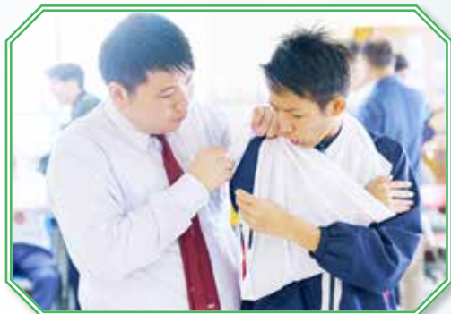
第二個部份的實習課程是包紮，由頭到腳，學生也要自己一手包辦。