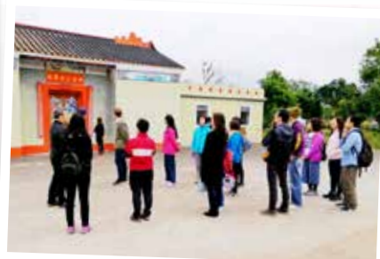
這一站：錦田。教師也齊齊考察，學習香港本土歷史文化承傳