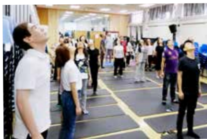
教師齊拉筋，身心皆健康