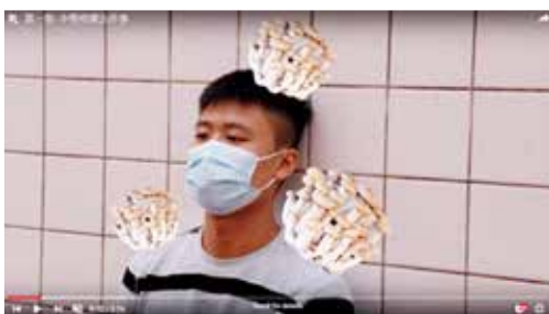
第一集《中學停課五件事》

生命教育往往要與時並進。我們生命教育支援組的成員在停課期間建立了「青年抗疫日常」影片頻道及「生命教育組與你共渡疫境」Google Classroom平台。透過網上的平台，逢星期五推出由生命教育組自編自導自演的短片，觸碰同學的心靈。同時，亦鼓勵同學創作短片參與「青年抗疫日常」短片創作比賽，讓同學可以在停課期間有一個另類的課外活動。最令我們鼓舞的是我們所做的也得到家長的認同及讚賞。