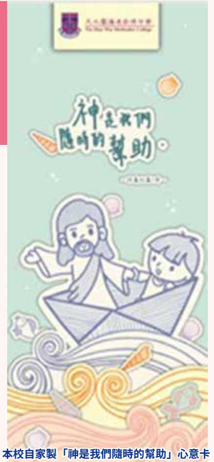
本校自家製「神是我們隨時的幫助」心意卡