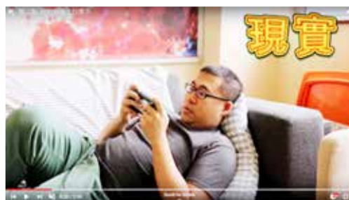
第二集《抗疫前後之日常》