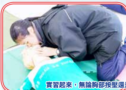
實習起來，無論胸部按壓還是人工呼吸，同學們都做得有板有眼。

這個急救課程對我來說真的是獲益良多，課堂上老師用心地教導我們的。雖然只有短短約十多個小時的實習課程，但我可以學到急救應有的態度，更可以真的去扮演一個急救員去幫助別人。這是一個非常難得的經驗，在我們日常生活中是不能做到的。對我來說，參加這個急救班是充滿樂趣，既可以充實自己的生活，又可以有一技之長去幫助別人，真是一舉多得。