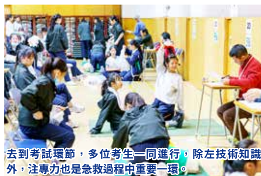
去到考試環節，多位考生一同進行，除左技術知識外，注專力也是急救過程中重要一環。