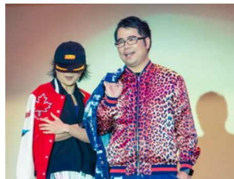
校長、老師、連卡佛義工，甚至家長亦參與台上、台下演出，與學生同行