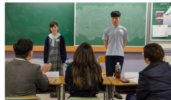
學生以英文課程中的「自我介紹」寫作練習參加模特兒甄選