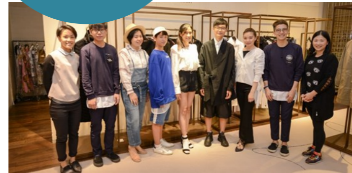
學生親身到連卡佛試造型，來個大變身！

連卡佛開放公司資源，職員花盡心思，既指導學生行天橋，又借出潮流服飾，讓學生轉眼化身成潮流模特兒。連卡佛的專業及優勢，將學生帶進真實的成人世界。