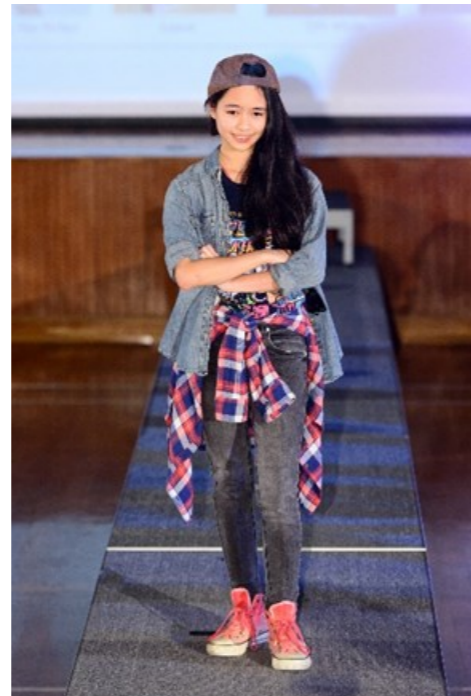
從試鏡脫穎而出的學生擔任模特兒，穿著潮流服飾走上天橋，以英語介紹衣飾特點

有勇氣走上天橋，原來未必都是英語能力較高的學生。參與同學大部份是成績中規中矩的一群。老師想不到，全級一百多名同學，竟有四十多位於午膳時到試鏡室排隊面試；平日難開金口的學生竟在教員室前請陌生的英文科老師逐字逐句示範讀音。