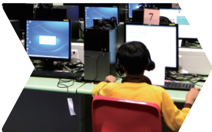
測試對象為小學高年級學生