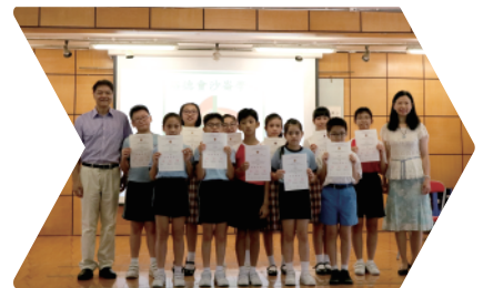
測試證書於測試後8個星期內發放