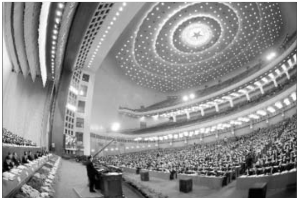
人民大會堂是中國全國人民代表大會開會的地方

國家主席的所有權力都源於其在黨內的權力，而並非國家權力。他被授予國家主席職位僅僅因為他作為黨的最高領導人。這就是中國政治體系最引人注目的異常現象：經過六十多年的制度建設，國家最重要的政治權力仍然由黨的機構產生並加以控制。