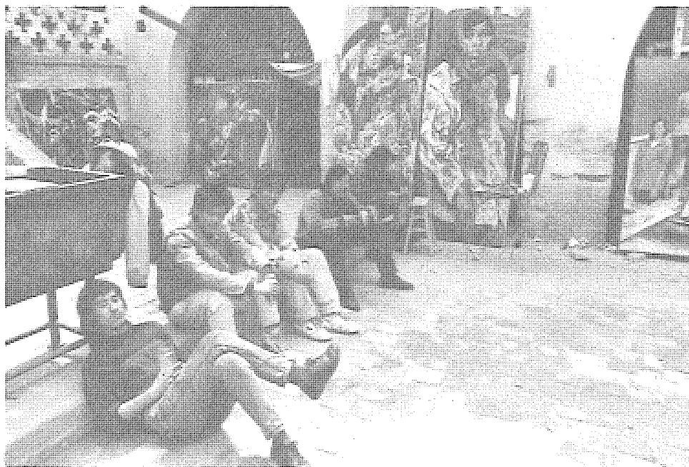
鄉村計劃·1993—— 畫家在活動地休息。

用大眾傳播媒介，照片、報紙、雜誌拼貼、錄像招貼應有盡有，所謂手製風格已成昨日黃花而被淹沒，比如在近日紐約展出的美國「雙年展」，幾乎看不到純繪畫。(5)強調藝術家、藝術應關注社會和生活，藝術家簡直成了批評家和政治批評家，民族問題、女權問題、性的問題(包括愛滋病)、戰爭和死亡問題等是目前藝術最為關注的主題。基於以上幾點，故新馬克思主義、弗洛伊德、德里達、拉康等人的理論非常流行於藝術評論界。