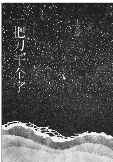
王安憶的新作《一把刀，千个字》講述新中國往事，一個不堪回首的故事。（資料圖片）

與此相關，我想再介紹王德威的新書《當代中國需要小說》（ Why Fiction Matters in Contemporary China ） 41 。此書評介當代華語小說中的幾十部重要作品，主旨是探討在當代中國的政治文化語境中，小說有何意義。王德威據以對話的正是自梁啟超以來各種關於「新中國」的宏大敘事，從梁啟超那一代政治領袖到當代中國領導人毛澤東、習近平，都強調政治理念、意識形態與講故事的關係，他們深諳小說中有建立國家、組成社會、完成制度的關鍵功能，這也是自二十世紀以來「新中國」未來故事之所以為一代代政權所必發揚的原因。當代中國進入新一輪的國家形象重構，國家領導人強調要「講好中國故事」，再次為「新中國」故事確立新的使命。